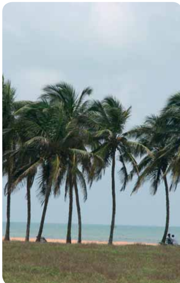
Le golfe de Guinée

Après Nicéphore Soglo (1991) et Kérékou (1996 et 2001), Boni Yayi a été élu en mars 2006.