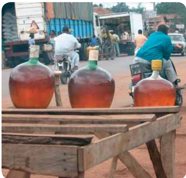
Pompe à essence