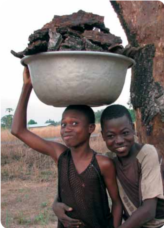
Des écorces comme combustible

Le Bénin compte 40 ethnies différentes, la plus grande étant les Fons qui représentent environ 49% de la population béninoise. Parmi les autres ethnies, il y a les Adjas, les Yorubas, les Sombas et les Baribas. Ces communautés coexistent pacifiquement.