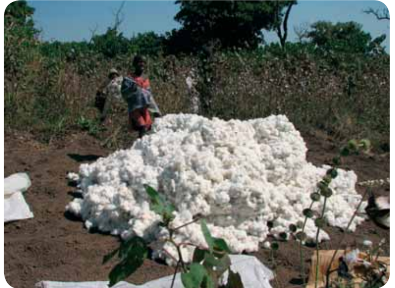
La récolte du coton