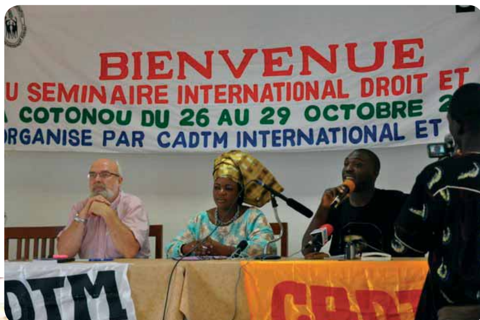
Réunion d'un groupement de femmes