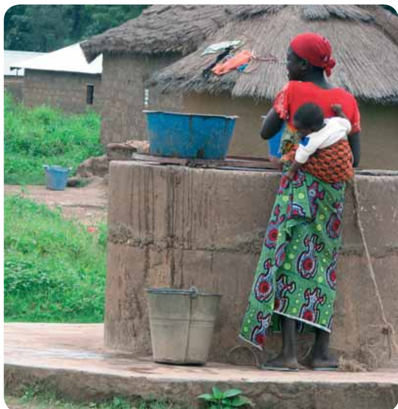
Au village de Monmongou