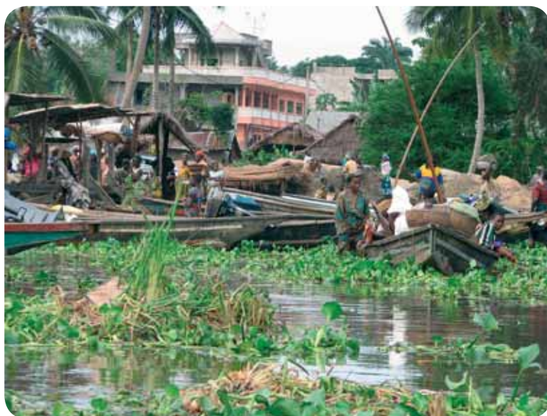
Ganvié, ville sur l'eau, la «Venise d'Afrique»