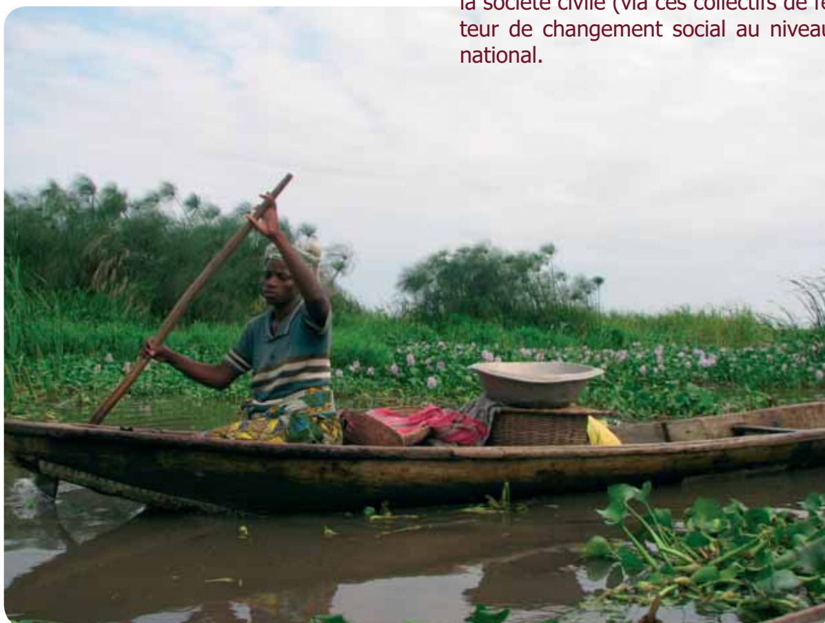
Déplacement à Ganvié

L'organisation des mouvements de femmes peut donc servir au changement politique de la société en poussant la société civile (via ces collectifs de femmes) à être vecteur de changement social au niveau local, régional et national.