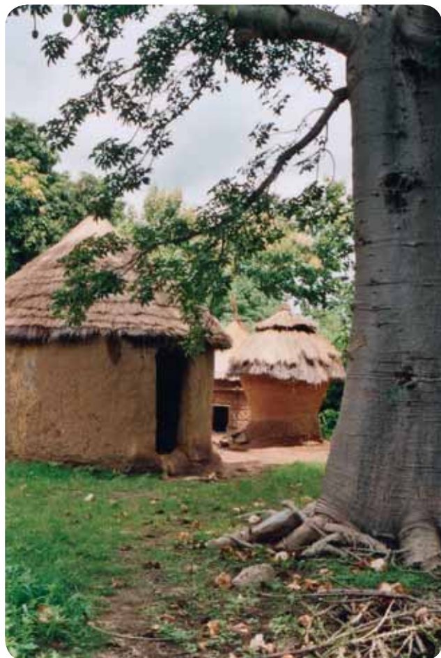
Concession: ensemble de maisons formant un plus grand ensemble

Les différents groupements de femmes sont, en réalité, des espaces que les femmes peuvent s'approprier afin de mettre en place leur solidarité. L'organisation de ces groupements ainsi que les formations proposées aux femmes permettent par la suite aux femmes de se mobiliser autour de questions comme celle du développement, de l'éducation, des droits humains, de la citoyenneté, etc.