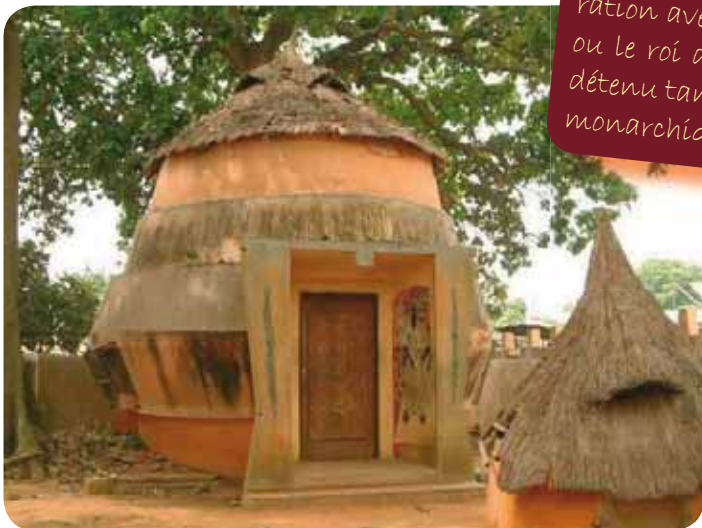
Temple Vaudou à Ouidah

La société béninoise se caractérise par la symbiose entre les structures «modernes» et vernaculaires: le guérisseur travaille en collaboration avec le médecin, on consulte d'abord le chef de communauté ou le roi avant d'intenter des poursuites judiciaires, le pouvoir est détenu tant par les institutions républicaines que par les structures monarchiques.