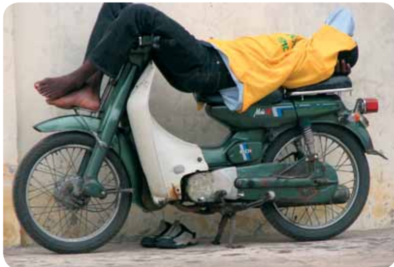
Conducteur de zemijan: le repos et le travail sur le même engin