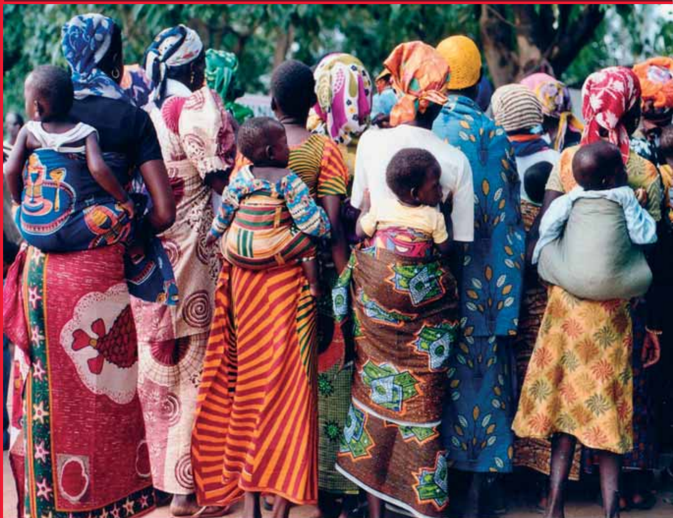
Les femmes de la communauté de Dendougou

Quinoa ashl Ong d'éducation au développement