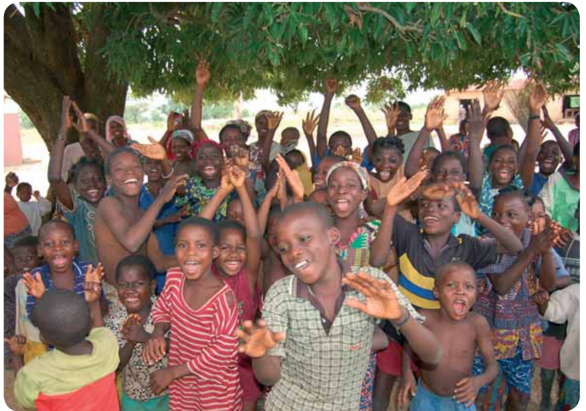
Les enfants de la communauté de Yarakéou

« Lorsqu'un programme de micro-finance est bien pensé, ancré dans la réalité politique et économique d'un pays, en lien avec d'autres organisations et est réellement entre les mains de ses destinataires (en l'occurrence les femmes aux conditions modestes), le pouvoir économique et le statut dans la société de ces destinataires peuvent être considérablement améliorés. »