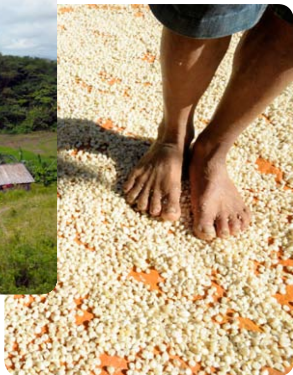
Séchage du maïs à Camindangan

En 1521, Magellan, célèbre explorateur portugais, est le premier européen à mettre les pieds aux Philippines. Dès 1565, l'archipel entre dans l'Empire colonial espagnol. À défaut de disposer d'or et d'épices, le pays est considéré comme une tête de pont pour l'évangélisation de la Chine et du Japon. Ce projet échoue, tandis que l'Eglise catholique se développe aux Philippines et reçoit des monarques espagnols des pouvoirs étendus. Les conséquences de la domination de l'Eglise qui a perduré jusqu'au début du 19ème siècle sont encore palpables: un foisonnement d'édifices religieux uniques en Asie, une économie dominée par l'importance de la propriété immobilière (lorsque les ordres se sont séparés de leurs biens après l'indépendance de 1898, ils les ont vendus à quelques grandes familles blanches ou métisses toujours puissantes), une culture à la fois relativement non-violente et conservatrice.