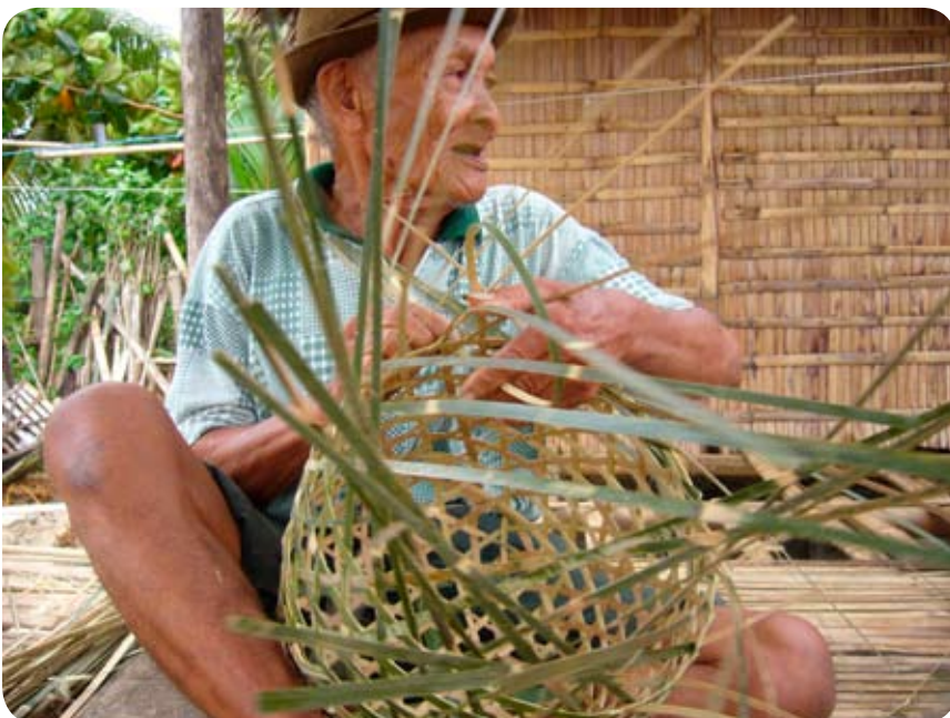
Tressage de panier

A travers cette expérience avec Quinoa, j'ai pu renouer, parallèlement à mon travail et à mon plus grand plaisir, avec la "coopération au développement". Le poste de responsable m'a permis de pouvoir associer la réflexion à l'action en vivant et faisant vivre un projet de solidarité internationale dans son entièreté. Ce fut une expérience riche en rencontres, en Belgique comme aux Philippines ; une expérience qui vous fait découvrir d'autres réalités, d'autres combats, d'autres besoins ; une expérience qui ébranle vos émotions ; une expérience qui vous transformera en citoyen du monde ! Elle m'a en effet confortée dans la nécessité d'agir, dans mon quotidien, à partir d'ici, pour un monde plus juste et respectueux de l'environnement et des être humains ! Act now !