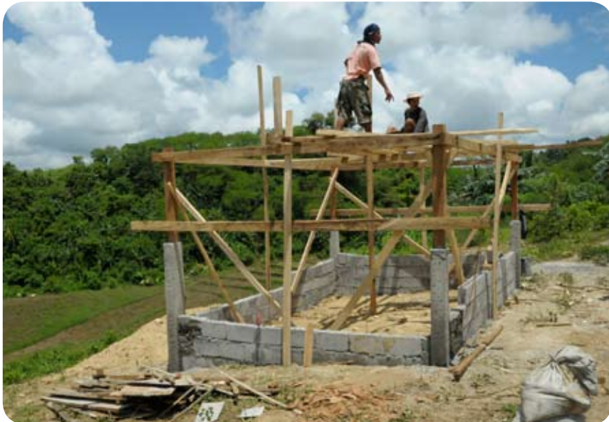
Construction d'une clinique communautaire dans les montagnes de Camindangan par les membres de l'association CASFA (partenaire de PDG)