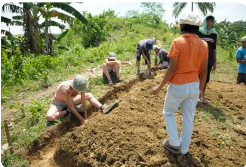
Les belges à l'ouvrage sur le chantier de construction de la clinique