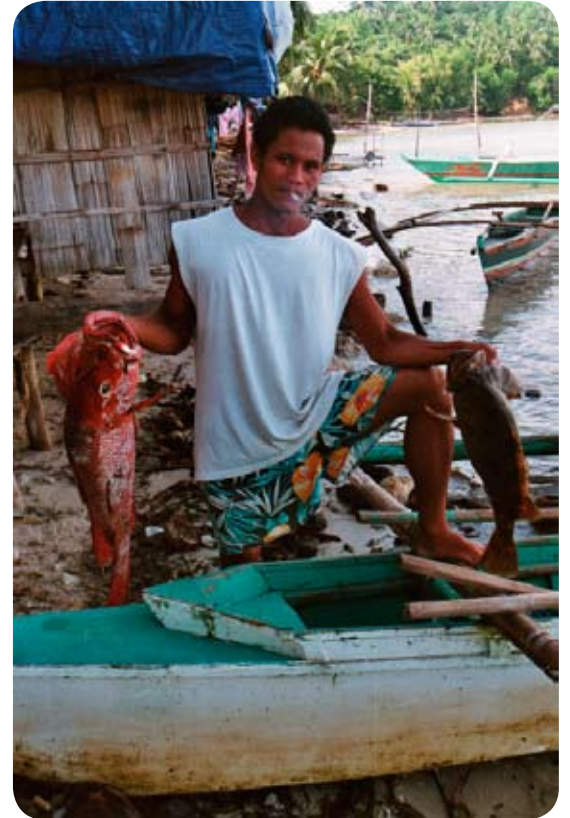
Pêcheur de la communauté de Sabang

PDG est à la base de 16 fédérations paysannes. Actuellement 60 associations locales ont vu le jour et se développent grâce à PDG. Cela représente plusieurs milliers de personnes bénéficiaires.