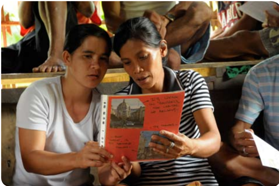
Présentation de la Belgique aux membres de l'association CASFA et aux familles d'accueil