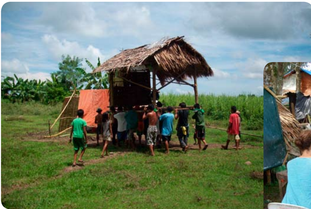
Déménagement d'une maison au camp de Bago