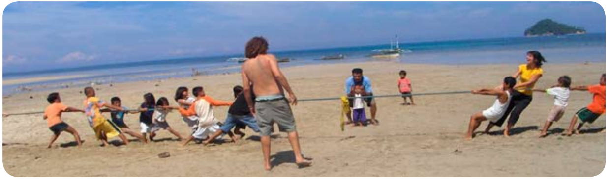
Jeux olympiques organisés par le groupe Quinoa 2007 pour les enfants de la communauté de Sabang