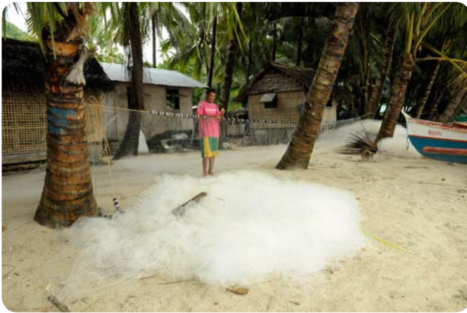
Pêcheur réparant son filet à Cayhagan