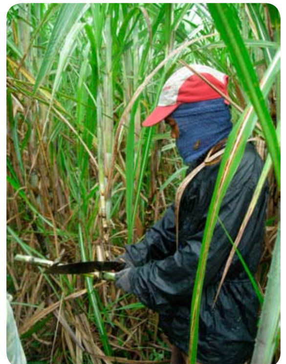
Ouvrier bien protégé travaillant dans les champs de cannes à sucre