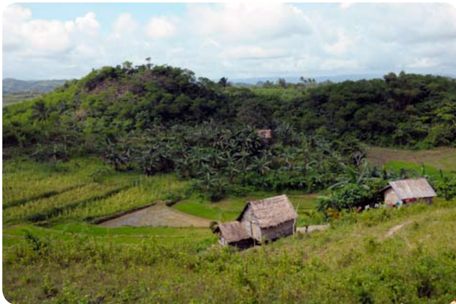
Rizières à Camindangan

La République des Philippines est une nation constituée d'un archipel de 7 107 îles se situant à l'ouest de l'océan Pacifique à environ 1 000 kilomètres au sud-est du continent asiatique. C'est l'un des deux seuls pays à dominante catholique en Asie (avec le Timor Oriental) et l'un des plus occidentalisés. L'Espagne et les États-Unis, qui ont tous deux colonisé le pays, ont chacun eu une grosse influence sur la culture philippine qui est un mélange unique d'Orient et d'Occident.