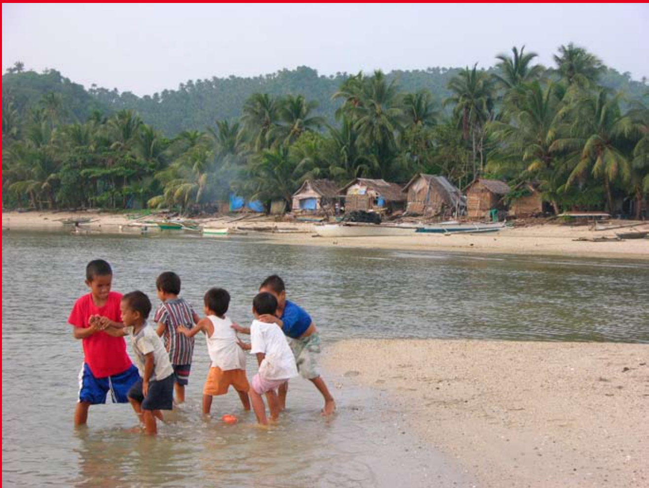
Village de pêcheur du Negros Occidental