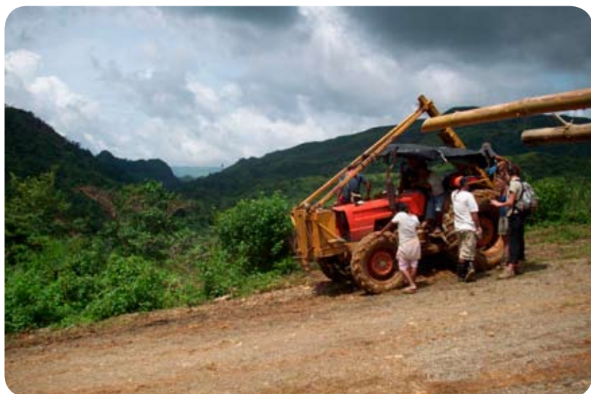
Interview du « community relation officer » près d'un site potentiel d'extraction minière dans les montagnes de Camindangan

Cette production s'organise autour de grandes haciendas. Ces dernières fonctionnent grâce à la main d'œuvre massive de « sugar workers » que l'on paye une misère et qui ne bénéficient la plupart du temps d'aucune sécurité d'emploi. Les salaires sont payés en retard et souvent les logements des ouvriers appartiennent aux patrons, ce qui accroît la capacité de pression de ces derniers. Autre caractéristique de l'île de Negros, son sous sol. Il recèle d'importantes ressources, notamment en cuivre et en or. Suite à l'application nationale des directives de l'OMC, ces ressources sont pour le moment essentiellement exploitées par des compagnies étrangères qui, pour tirer profit de ces ressources, n'hésitent pas à corrompre les élites locales. Au-delà de cette masse financière dont sont privés les philippins, ces mines laissent de grosses cicatrices dans l'environnement, générant la destruction d'hectares de terres cultivées et la pollution des littoraux (poissons, coraux, etc...).