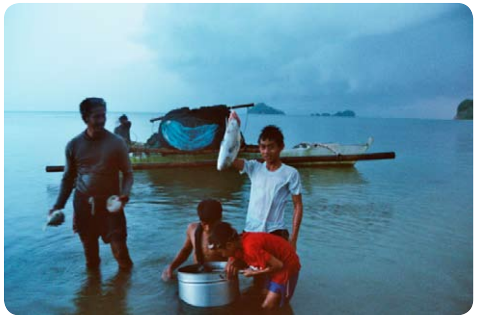
Pêcheurs de la communauté de Sabang