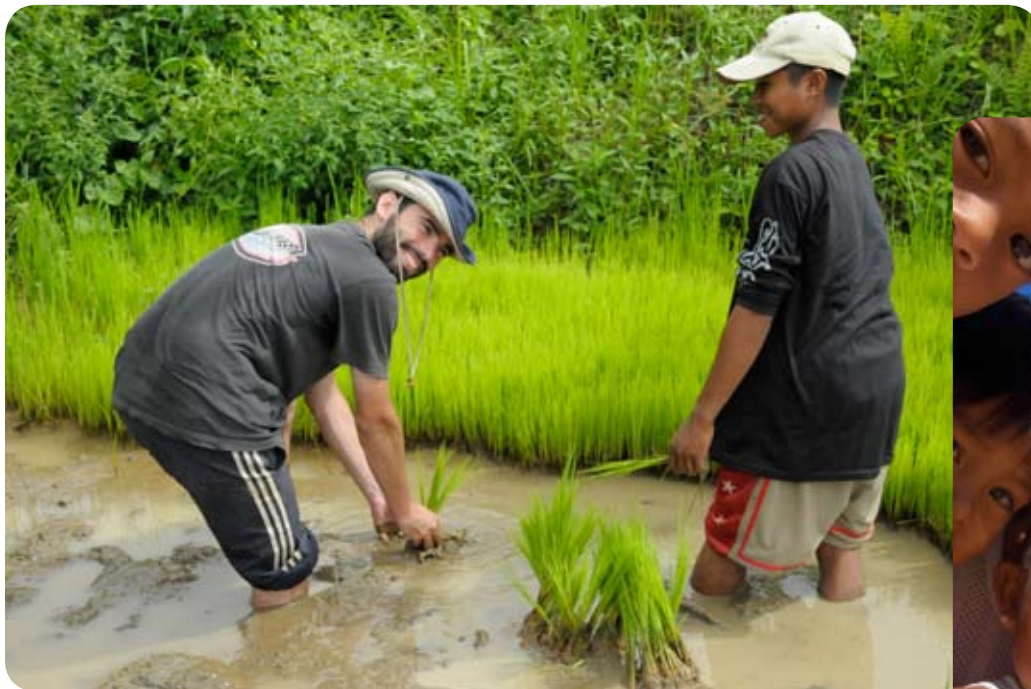
Apprentissage du repiquage du riz lors d'une visite de terrain avec l'association Masipag qui travaille notamment dans le secteur de l'agriculture durable