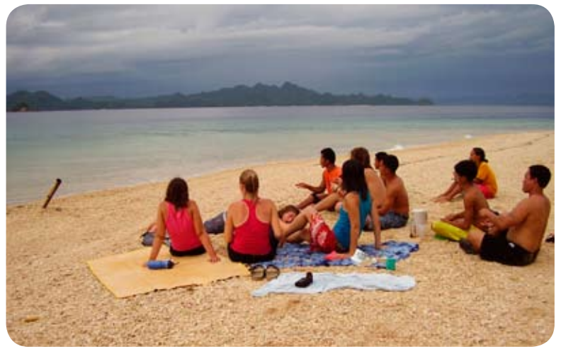
Détente sur la plage près de Sabang

Une participante au projet Philippines 2008