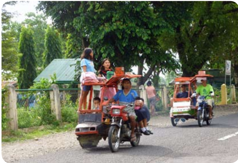
Moyen de transport philippin type