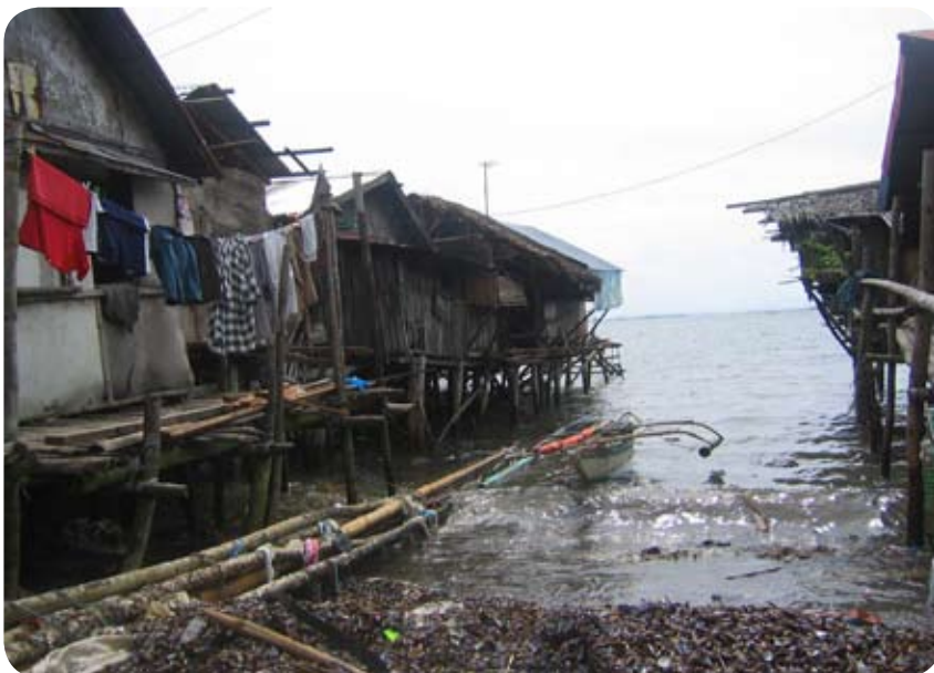
«Urban poor area» de Bacolod