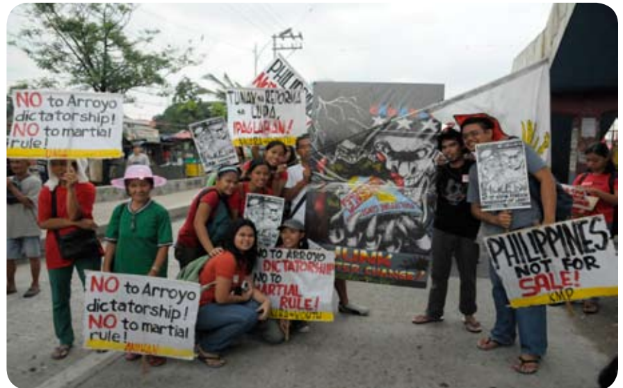
Manifestants à Manille en 2009 lors du discours annuel du président (SONA), pour protester contre le régime dictatorial et la loi martiale en vigueur aux Philippines