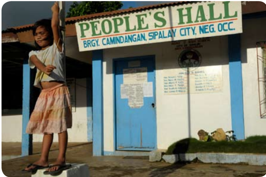
Scène de rue à Camindangan