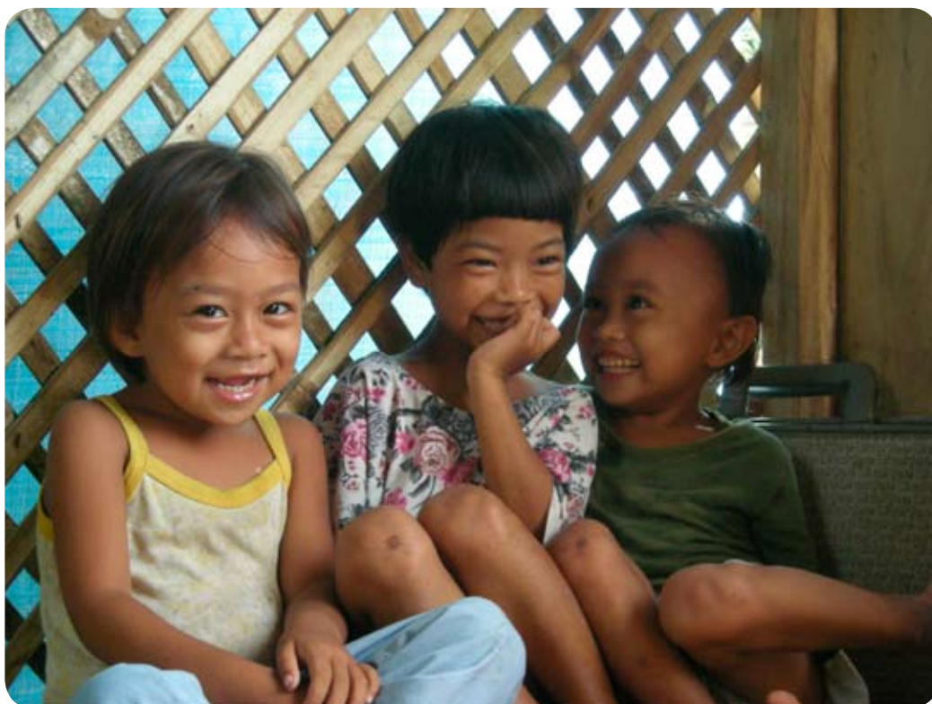
Enfants de la communauté de Cantagap

“ Bienvenue aux Philippines, là où l'Asie arbore un sourire!”